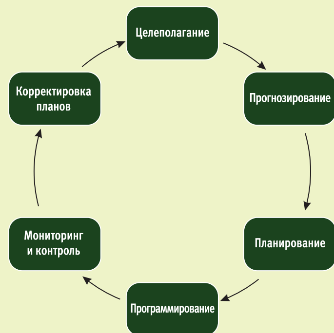
Рис. 3. Этапы стратегического планирования в лесном хозяйстве Российской Федерации