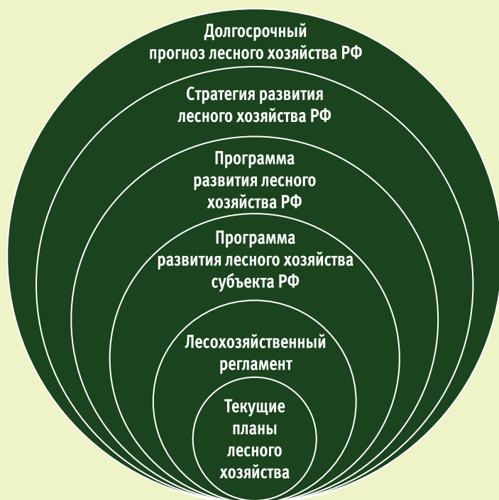
Рис. 4. Перспективная система лесного планирования в Российской Федерации

дерации лесной план должен быть заменен долгосрочной программой развития лесного хозяйства региона. Этот вариант может обеспечить значительную экономию бюджетных средств за счет отмены лесных планов.