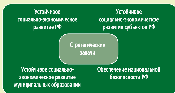
Рис. 2. Задачи стратегического планирования в лесном хозяйстве